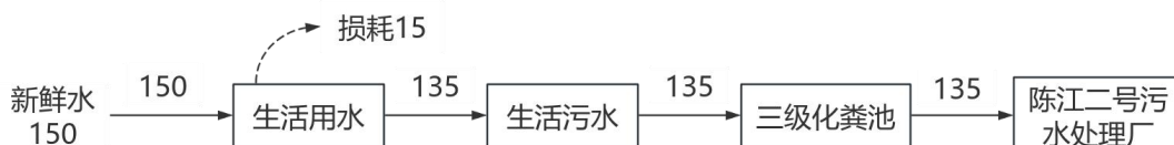
图 2-2 水平衡图 (t/a)

项目无生产废水产生及排放，外排废水为生活污水，根据《室外排水设计规范》（GB50014-2006），居民生活污水定额可按当地相关用水定额的 80%~90% 来定，本项目产污系数取 0.9，则生活污水产生量为 135t/a（0.45t/d）。项目生活污水经三级化粪池预处理后排入市政污水管网，纳入陈江二号污水处理厂处理。