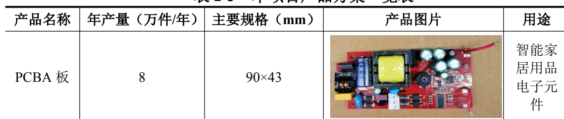
表 2-3 本项目产品方案一览表